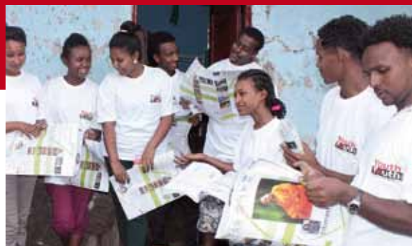
Jugendberater des Netsebraq Youth Club in Addis Abeba bereiten sich auf eine Aufklärungsveranstaltung vor.